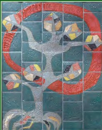
Tableau: 'Samen anders zijn, anders samen zijn' Locatie: Bakheide (Blokhut Jong Nederland) Ontwerper: Herman Driessen/Jong Nederland Beesel Atelier: St. Joris Jaar: 1996 Omschrijving: Een levensboom met takken en wortels verglaasd in vijf kleuren die symbool staan voor de huidskleuren van de verschillende bevolkingsgroepen. Samen met de grijze boomstam (een mix van alle kleuren) stellen een multiculturele samenleving voor. Dit tableau is gemaakt in opdracht van en in samenwerking met Jong Nederland Beesel.