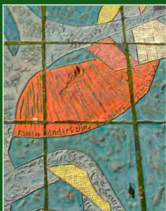
Tableau: 'Samen anders zijn, anders samen zijn'