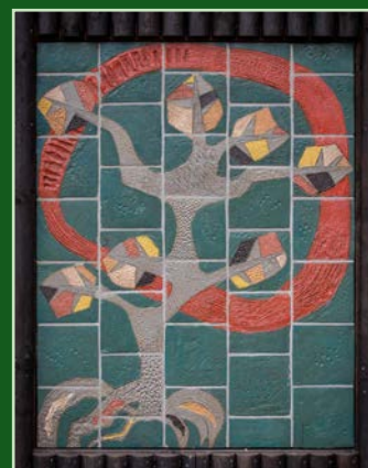
Tableau: 'Levensboom' Locatie: Bakheide 2 (Blokhut Jong Nederland) Ontwerper: Herm Driessen/Jong Nederland Atelier: St. Joris Jaar: 1996

Omschrijving: Een levensboom met takken en wortels, verglaasd in vijf kleuren die symbool staan voor de huidskleuren van verschillende bevolkingsgroepen. Samen met de grijze boomstam (een mix van alle kleuren) stellen ze een multiculturele samenleving voor en vertellen ze ons: 'Samen anders zijn, anders samen zijn'. Dit tableau is gemaakt in opdracht van en in samenwerking met de leden van Jong Nederland Beesel.