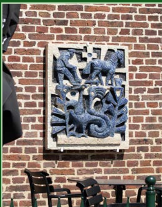
Tableau: 'Isidorus' Locatie: Markt 13 Ontwerper: Jules Rummens Atelier: Loré Jaar: 1960 / 2024

Omschrijving: Deze plaquette is door Jules Rummens bij Loré gemaakt in opdracht van de Boerenleenbank. Daar sierde ze de entree van het bankgebouw in Beesel. De ploegende boer met de korenaren verwijzen naar de Heilige Isidorus: patroonheilige van de boeren. Het kruis en de ploeg verwijzen naar het logo van de Boerenbond: de organisatie die de Boerenleenbank heeft opgericht. Uiteraard mag de Beeselse draak niet in het tafereel ontbreken.